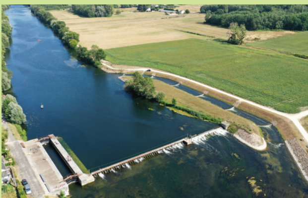
Rivière de contournement du barrage de Civray (Cher), 2020

Au travers d'une série de brèves vidéos en «survol», nous vous présentons des sites emblématiques ou controversés. Pour commencer, retrouvez un survol du barrage à aiguilles de Civray, sur le Cher aval ainsi qu'un survol du tracé RN88 en projet (Haute-Loire)