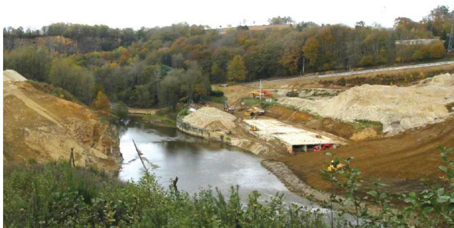
Le fleuve Sélune libéré. Inspiré par les effacements de barrages sur le bassin de la Loire, le barrage de Vézins a été arasé